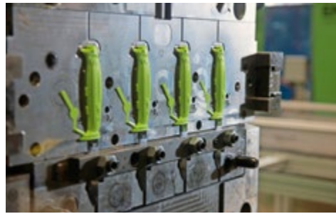
Im ersten Spritzgießschritt werden die Messerklingen mit Polypropylen umspritzt. Die Rippenstruktur ist ein wichtiger Schlüssel, um die Vorspritzlinge schneller weiterverarbeiten zu können.