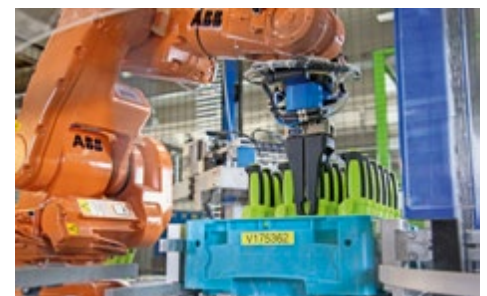
Der kleinere der beiden Mehrachsroboter entnimmt die fertigen Messer samt Scheiden aus den Trays, um sie direkt im Verkaufsdisplay zu platzieren.