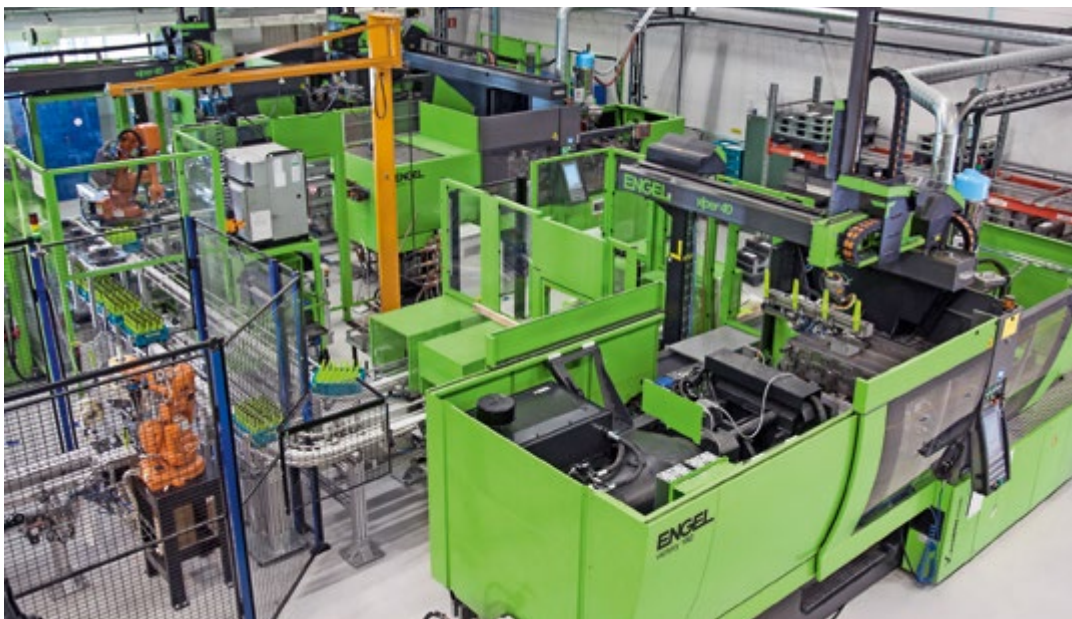
Gabriel, so nennen die Mitarbeiter von Morakniv die hochintegrierte und vollständig automatisierte Fertigungszelle. Pro Stunde liefert sie 480 Outdoormesser.