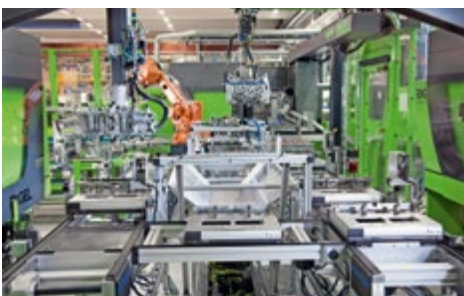
Das umlaufende Transportsystem im Zentrum der Fertigungszelle verkettet die drei Victory 120 Maschinen, welche die Messergriffe produzieren.