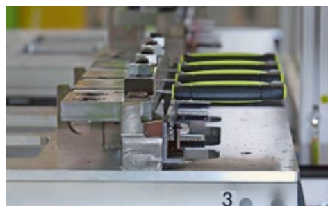
Bis zum Abschluss der Griffherstellung bleiben die Messer im Viererpack auf der Trägerleiste fixiert. Dann übernimmt wieder der große Mehrachsroboter.